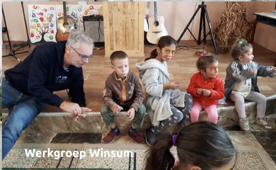
Testify To Love